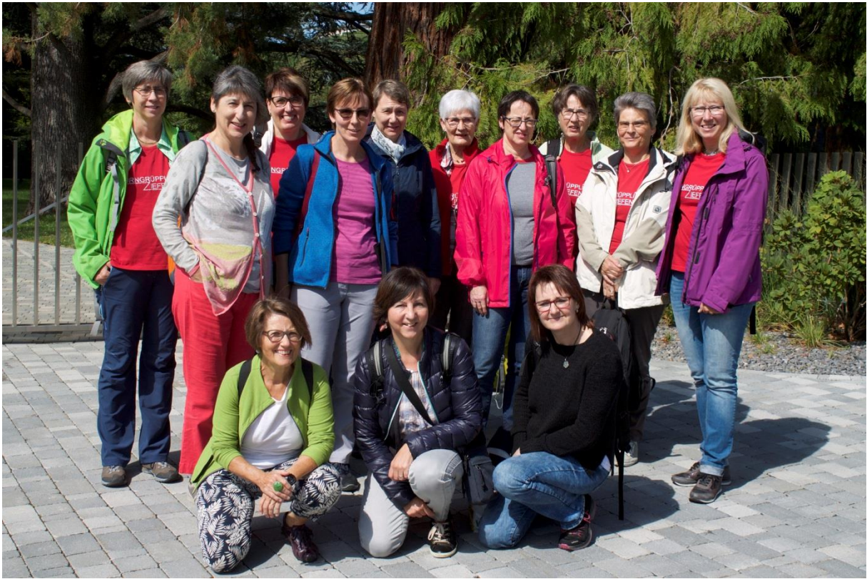
Vor der Besichtigung machten wir noch schnell ein Foto von uns farbenfrohen Frauen